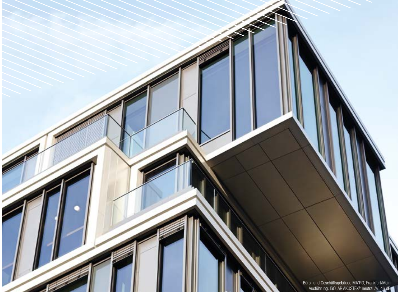
Büro- und Geschäftsgebäude MA'RO, Frankfurt/Main Ausführung: ISOLAR AKUSTEX® neutral ///, 46 dB